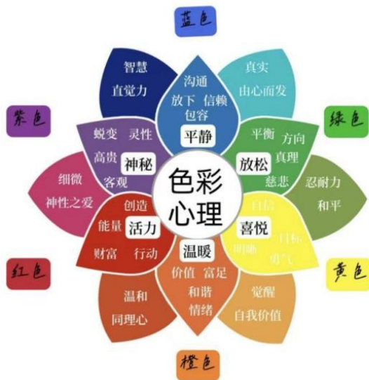
图2 色彩心理图

和印刷工艺的了解和偏好,帮助研究者分析不同群体对于色彩与印刷工艺的情绪感知差异。首先,问卷包含关于色彩情绪评估的部分,让受访者对不同色彩(例如红色、蓝色、黄色、绿色等)进行情绪反应评分,并询问受访者的在观看此颜色是心理的情绪反应,例如红色带给人的热情、激情,蓝色的理智、平静,白色的单纯、无私,黑色的神秘感、沉重等(卢海霞 2008),了解他们对色彩的情绪反馈。将色彩组合类型样图在一定人群中进行测试,验证不同类型色彩组合能够引起人们的相应情绪反映,为后续研究工作提供依据(王洪波 2013)。