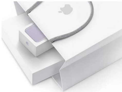
图4 苹果产品包装

苹果公司的简洁白色包装(如图4),白色作为主色调,传递出一种纯净、简约、科技的视觉效果。这样的选择本身就是一种设计思想的极致——去除掉所有不必要的元素。让消费者在接触苹果产品时感受到一种高端、前卫、简约的生活方式。除了视觉层面,在包装印刷上采用一般为高质量的光滑纸张结合烫银工艺,提升产品包装的高端感,这种精致、细腻的触感,让消费者在触觉上享受到高质量的体验,引发消费者的情感共鸣。