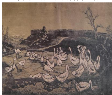
图 1-4 鹅群 邹杰 木刻水印 23*38cm 1956 年（中）