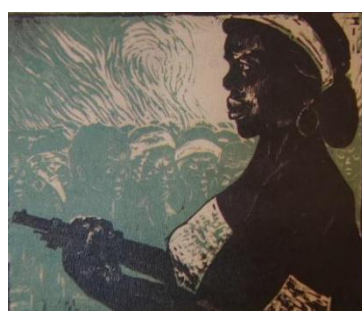
图 1-5 非洲的母亲 邹杰 木刻水印 27*32cm 1964 年（右）