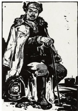
图 1-1 守护员 徐甫堡 木版水印 38.8x26.4cm 20 世纪 50 年代（左）

木刻，能看出画面的处理是西方受到了黑白木刻的影响，画面强调了版画的刀味和版味。同期，余白墅、刘王斌创作的《小饲养员》（图 1-2），画面聚焦人民生活的状态，可看出水印版画在题材上也有所突破，人物刻画沿袭了传统水印木刻中的水味，可以看出生活场景的出现在了水印版画创作中。邹杰的《老桥今修》（图 1-3）、