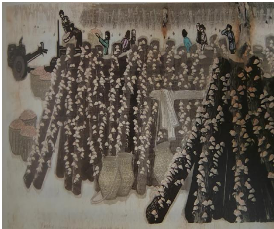
图 1-6 新菇飘香 龚声 水印木刻 43x91cm 70 年代

朴实的农民劳作和带有地方特色的少数民族过节庆,注重体现江西地区的风土人情,创作有江西特色的版画作品。