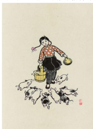
图 1-2 小饲养员 余白墅、刘王斌 木版水印 38.8x26.4cm 20 世纪 50 年代（右）