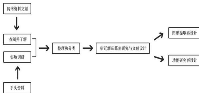
图 2 宿迁缅茄篆刻研究框架图

深入挖掘宿迁的历史文化、民俗风情,将其与缅茄篆刻相结合,开发具有宿迁特色的文创产品。首先提前收集缅茄篆刻的资料和文献进行查阅了解,接着实地考察去深入挖掘缅茄篆刻与宿迁地域文化内涵,并结合手头资料进行分类和整理,最后提取再设计和创新运用,整理框架如图 2 所示。例如,以宿迁的历史名人、名胜古迹、传统节日等为主题,创作系列缅茄印章,展现宿迁独特的文化魅力。设计以项羽为主题的缅茄篆刻印章,将项羽的英勇形象和相关事迹通过篆刻艺术表现出来;或者以宿迁骆马湖的自然风光为灵感,创作出富有诗意的印章作品。除了传统的印章形式,还可以拓展文创产品的种类。开发缅茄篆刻挂件,如手机挂件、钥匙挂件等,方便人们随身携带,作为日常装饰;制作缅茄篆刻摆件,摆放在家中或办公室,增添文化氛围;推出缅茄篆刻书签,将文化与阅读相结合,满足文艺爱好者的需求。通过融入这些特色地域文化,使其文创产品不仅具有独特性和代表性,还能够引起消费者的共鸣,增加他们对宿迁本地文化的认同感和归属感。