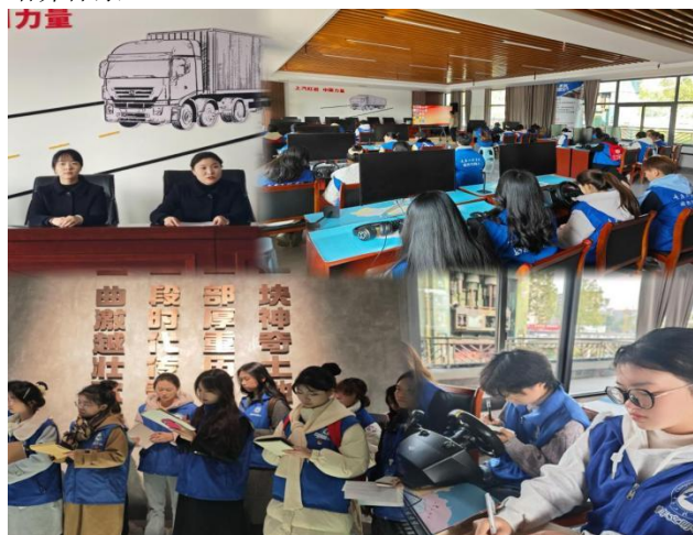
图3 校馆联合现场培训志愿者讲解员