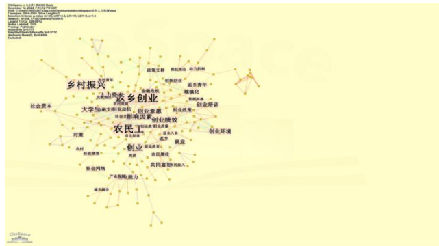
图 1-1 返乡创业研究相关文献关键词共现网络

主题。通过关键词共现分析能够揭示文中的研究热点问题。可视化图谱结果显示, 共纳入 189 个节点 ( N=258 )、320 条连线 ( E=320 )、节点密度 ( Density=0.0097 ), 将关键词出现频次 \geq 10 的关键词导出, 并将同义词和近义词进行共现合并, 关键词共现网络图如图 1-1 所示, 由图 1-1 可知, “返乡创业”、“农民工”、“乡村振兴”、“创业”、“创业绩效”、“影响因素”、“创业意愿”、“人力资本”、“创业环境”、“大学生”显示的关键词节点较大, 说明者 10 类关键词在相关的文献中集中出现的次数呈现出绝对的优势。